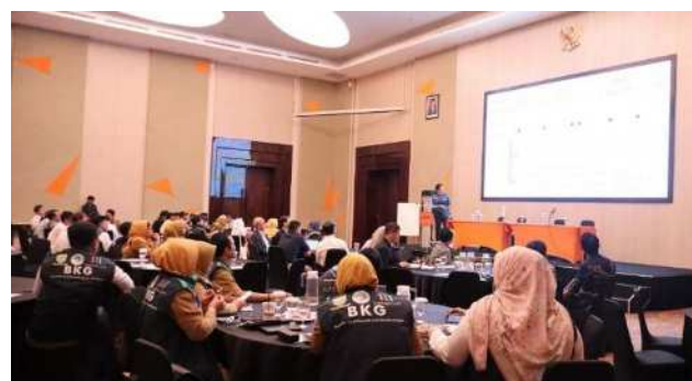
職員研修(バンドン市)