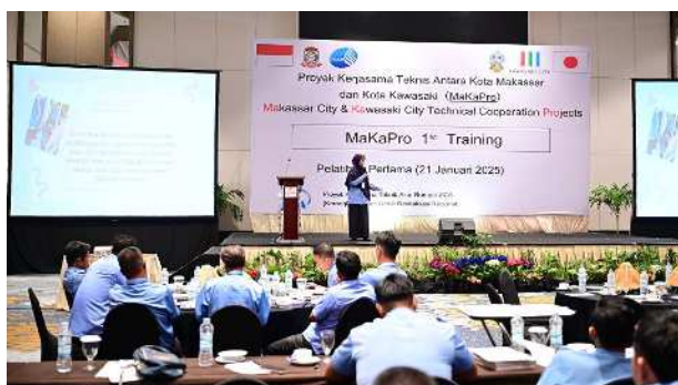
職員研修(マカッサル市)