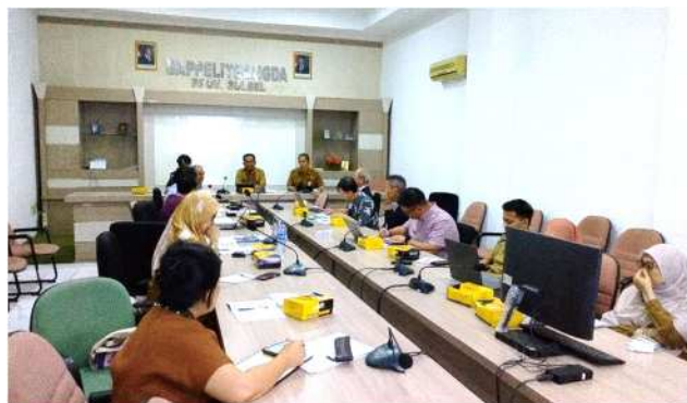
現地関係機関幹部との面談