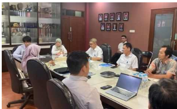
現地関係機関幹部との面談